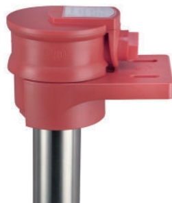
Thermoplongeurs modèles angulaires avec support HWB

La puissance surfacique en W/cm^2 y est donnée pour la longueur nominale du tube plongeur horizontal chauffé et pour la puissance nominale. L'adaptation à la puissance surfacique maximale admise par le liquide de process est possible sans problème en jouant sur la puissance nominale et sur la longueur du tube plongeur.